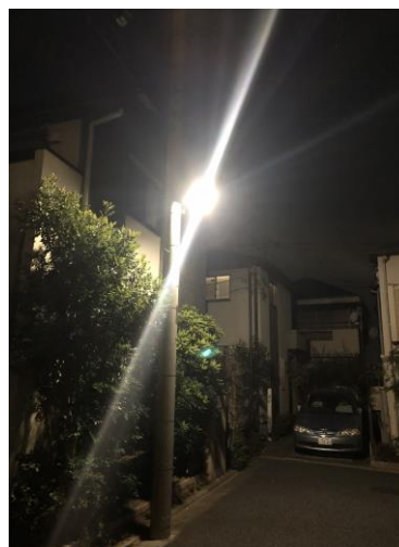
〈修理後/明るくなりました〉