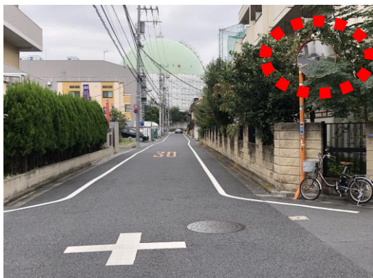
〈 剪定前/見づらいです 〉

『カーブミラーが見えやすくなり安心して通れるようになった！』との喜びの声をいただきました。