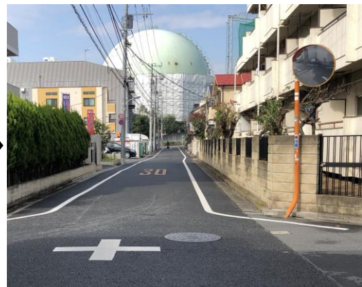
〈 剪定後/見えやすくなりました 〉