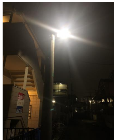
〈修理後/明るくなりました〉