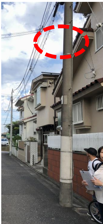
〈 設置前 〉